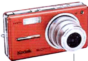
5 Design et ultra-compact, Kodak EasyShare V530, appareil numérique conçu pour les femmes.