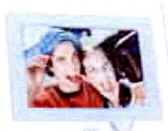
2 "Souvenirs, souvenirs", des photos défilent sur un cadre numérique LCD Phillips.