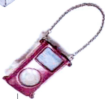
4 Chic, Jewel Métallique.