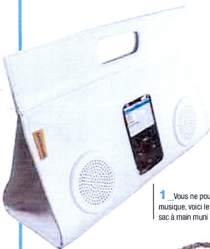
1 Vous ne pouvez vivre sans musique, voici le Groove Bag, sac à main muni de haut-parleurs.