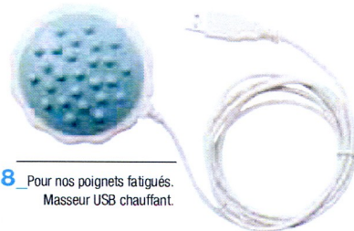
8 Pour nos poignets fatigués. Masseur USB chauffant.

1 Groove Bag, sac à main doté de poignées avec amplificateur, pour tout iPod. Felicidad, www.drbot.fr 145 € 2 Petit écran LCD qui fait fonction de cadre photo. Vous pouvez le brancher à votre PC ou appareil photo. Capacité : 80 photos, format 10 x 15, autonomie : 1 h, Phillips 249 € 3 Le Tetran, une petite tête qui assure un enroulement optimal des câbles et un rangement pour les oreillettes. Tuneware, www.drbot.fr , 13 € 4 L'étui bijou rose-argent pour Nano, aspect métallique avec ceinture fantaisie incrustée de brillants, muni d'une petite chaînette, www.drbot.fr 29,95 € 5 Pas plus grand qu'un jeu de carte, équipé d'un zoom optique, ce modèle offre une résolution à 5 millions de pixels, objectif à zoom optique 3 x. Il existe en argent, noir, rouge, rose. Kodak www.kodak.fr 263,45 € 6 Exclu, basket Nike-Apple. Le kit Nike iPod comprend un capteur-émetteur incorporé dans la chaussure et un récepteur qui s'insère à l'iPod. Les runners peuvent créer leurs propres listes de lecture, adaptées à la course et au parcours. www.nike.com/nike . Air Zoom Moire : 100 € et Nike iPod Sport Kit : 29 € 7 Le Water Clock, un joli réveil qui fait aussi fonction de réveil décoratif, www.thinkgeek.com 13 € 8 Le masseur USB chauffant est alimenté par la prise USB de votre ordinateur. Un ventilateur séchera votre french manicure, www.allnum.com 10 €.