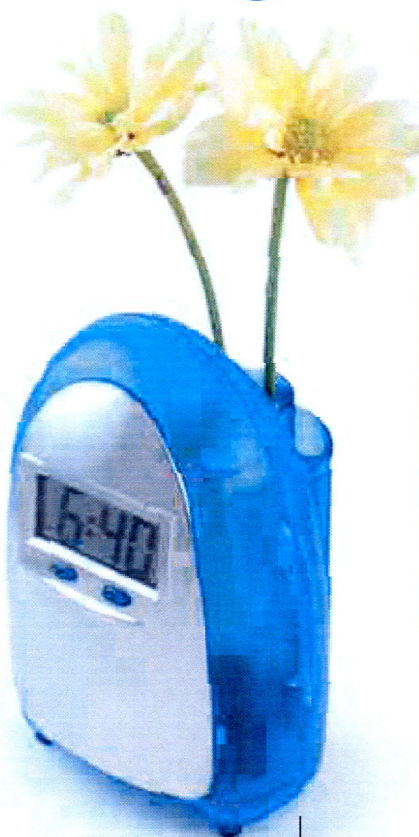
7 Pour les matins difficiles, le Water Clock, réveil fleuri. Il s'alimente grâce à l'électrolyse. Nul besoin de piles mais pensez à changer les fleurs.