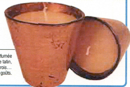
8 - Gourmande, une bougie parfumée aux gâteaux : tarte tatin, tiramisu, muffin, bavaois... Il y en a pour tous les goûts.