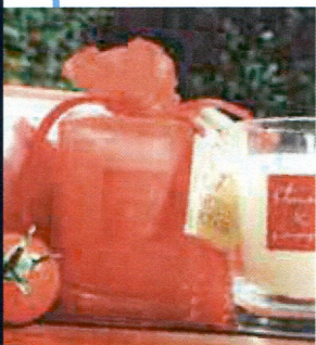
5 - Vous aimez les légumes ? Goûtez aux bougies du potager : tomate, carotte, verveine...