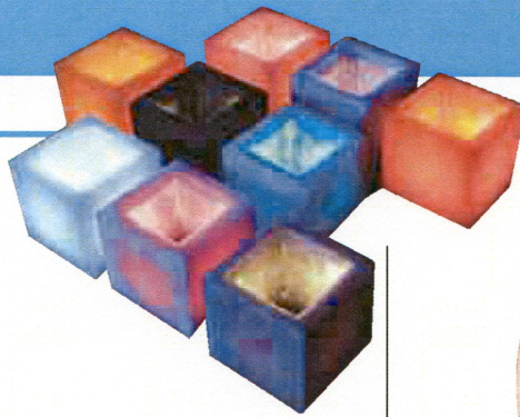
2 - Illuminez vos tables de jardin, vos allées et balcons avec des photophores aux couleurs de l'été.