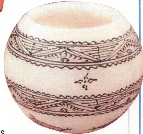
3 - Destination Marrakech. Tout le charme de l'Orient avec ce photophore au henné.