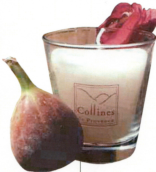
6 - Un petit tour vers la Provence pour cueillir la bougie à la figue des Alpes.